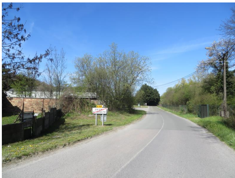
Environnement proche : rue de l'Obernaude avec aperçu du site en arrière-plan

Le site de l'opération se situe sur les deux communes limitrophes de Neuville et Thenelles. L'accès au terrain se fait depuis la rue de l'Obernaude, au Sud de la commune de Neuville. Le projet de chaufferie CSR (Combustible solide de récupération) s'intègre dans la continuité du site Tereos d'Origny-Sainte-Benoite. Le terrain est cerné par un site industriel à l'ouest (Tereos), une déchetterie sur la parcelle voisine à l'est, la voie d'accès (D707/rue de l'Obernaude) au nord et enfin, un talus planté avec une route départementale (D1029) au sud. Les cotes NGF du terrain vont de 75,80 à 80,80 sur un terrain d'environ 130m sur 100m.